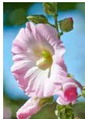
Alle seizoenen Kleurrijk bloeiend