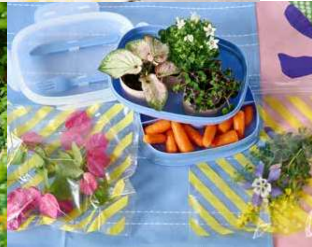
Praktisch en gezond