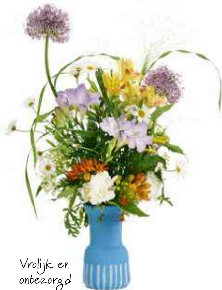
Vrolijk en onbezorgd

In dit interieur van onbezorgd genieten staat het groene geluk centraal. Er is veel aandacht voor bloemen en vooral ook voor bloeiende planten. Groepjes kleurrijke bloeiende planten geven het interieur een positieve energie.