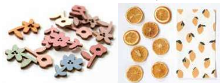
Dessins van fruit

De gebruikte materialen zijn makkelijk en praktisch in gebruik en hebben een vanzelfsprekende en vriendelijke look. Keramiek, gekleurd glas, praktisch kunststof, textiel, raffia en granito zijn hier perfecte voorbeelden van.