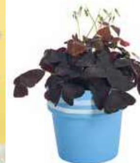
Aandacht voor het thema liefde en geluk