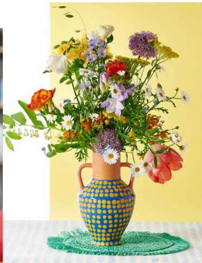
Fris en alledaags