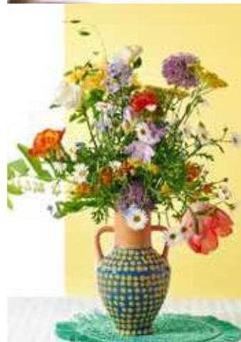
Bont kleurgebruik in boeketten