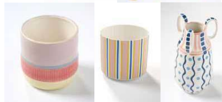
Vrolijk met aandacht voor detail