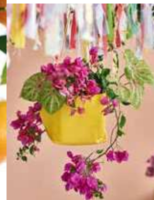
Meer aandacht voor bloeiende kamerplanten