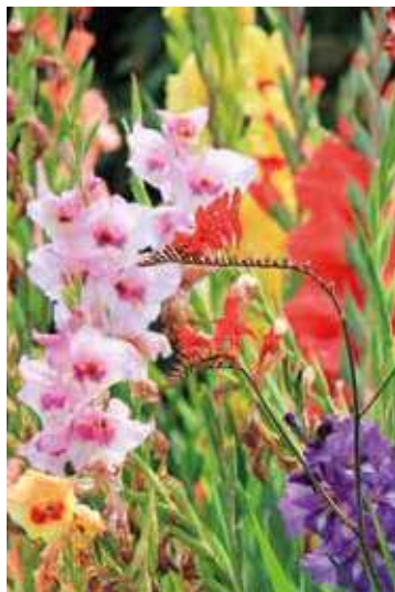
Bloemenpracht waar je vrolijk van wordt

Vrolijke bonte borders, gekleurde parasols en opvallende, feestelijke accessoires maken de tuin de place to be. Pluktuinen waar vrolijke bloemenborders de toon zetten zijn de nieuwste versie van de moestuin.